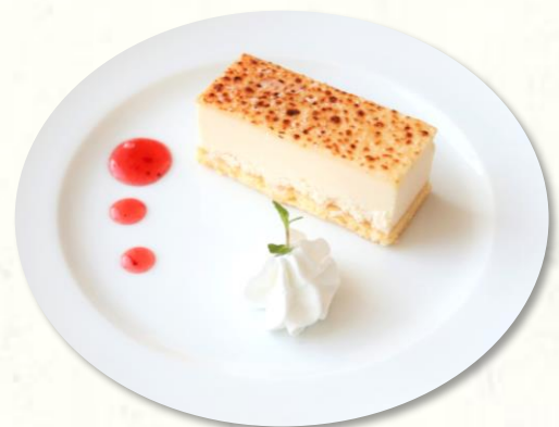
ブリュレチーズケーキ クリームチーズとチェダーチーズを使用し表面に丁寧に焼き色をつけたケーキ。