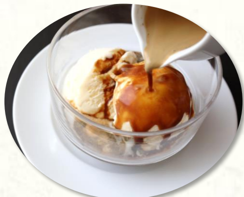
アフォガード 冷たいバニラアイスに淹れたての香り高いエスプレッソをかけてお召し上がりください。