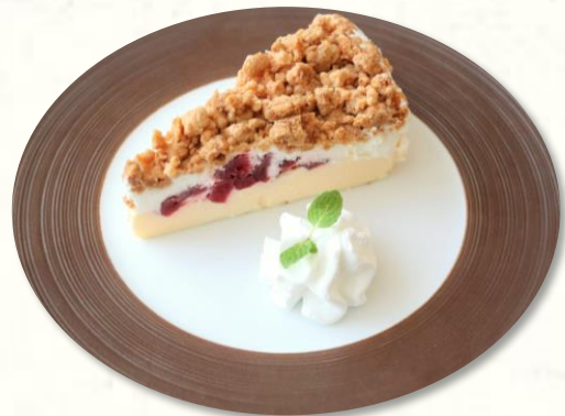
セミフレッド クランブルチーズケーキ チーズムースとホイップクリームの間には洋酒漬けのクランベリーをサンドしたアイスケーキ。 ※アルコールを使用しています