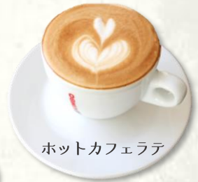
ホットカフェラテ