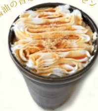
ソイソース キャラメルミルク