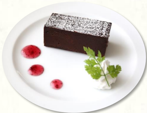
濃厚ガトーショコラ クーベルチュールチョコレートを使用した濃厚なケーキ。